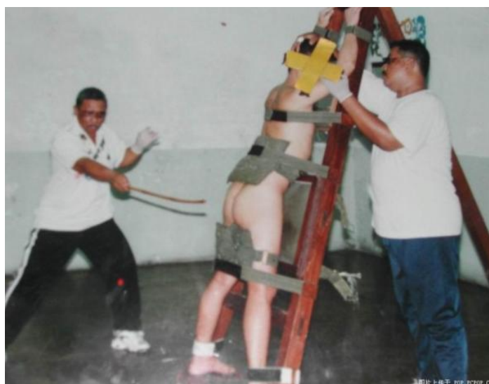
圖一：鞭刑行刑實況